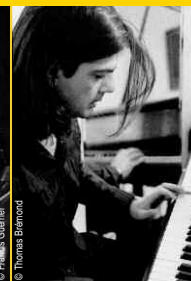
© François Guener / © Thomas Barraud

Leurs parcours musicaux sont intimement liés depuis l'aventure de Sixun, fondé avec Paco Séry en 1984 et qui fut pendant quinze ans la formation de référence du jazz-fusion. Depuis, chacun a poursuivi son chemin (Winsberg avec Jaleo, Como en solo), mais les deux frères de musique continuent à se retrouver régulièrement (en plus de la réactivation occasionnelle de Sixun) pour des duos nourris de leur longue et profonde complicité.